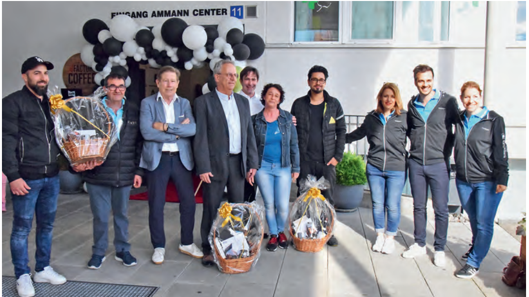
Das Ammann-Center ehrte verschiedene Firmen und Institutionen (Bild), welche dem Center seit vielen Jahren die Treue hielten.