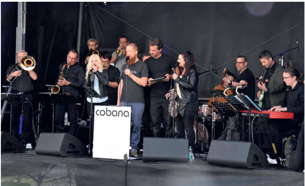
Die Cobana-Band sorgte für tolle Stimmung am Freitagabend.