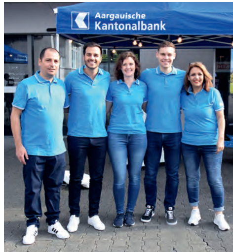
Das aktuelle Team der Kantonalbank-Filiale Oberentfelden feierte 10 Jahre.