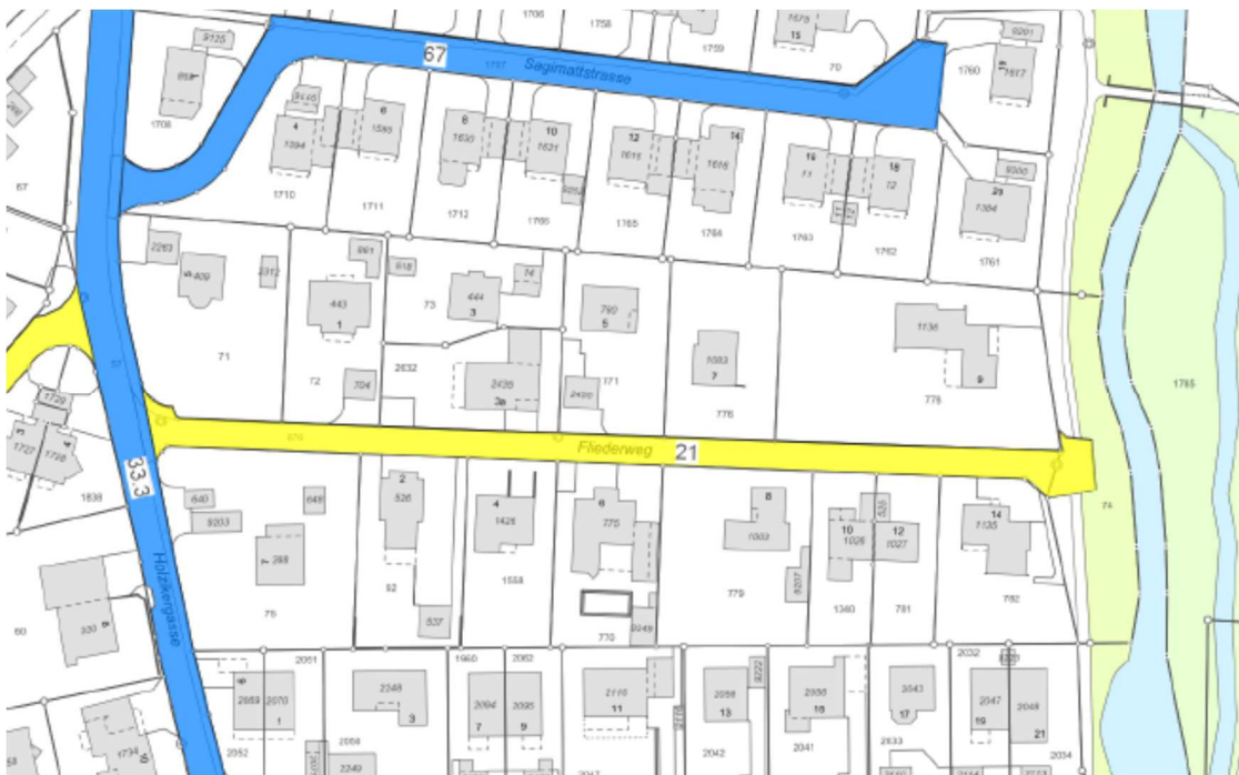
Situationsplan; Abschnitt 21 Fliederweg; Werterhaltungsplanung

Der Fliederweg weist auf der gesamten Länge von zirka 180 Metern einen erheblichen Unterhalts- und Sanierungsbedarf auf. Die Schmutzwasserleitung, die Wasserleitungen und das Elektrotrasse müssen ersetzt werden. Da bereits Projekte für Neubauten von kleineren Mehrfamilienhäusern vorliegen, drängt sich die zeitgleiche Anpassung der Werkleitungen und die Sanierung des Strassenabschnittes auf.