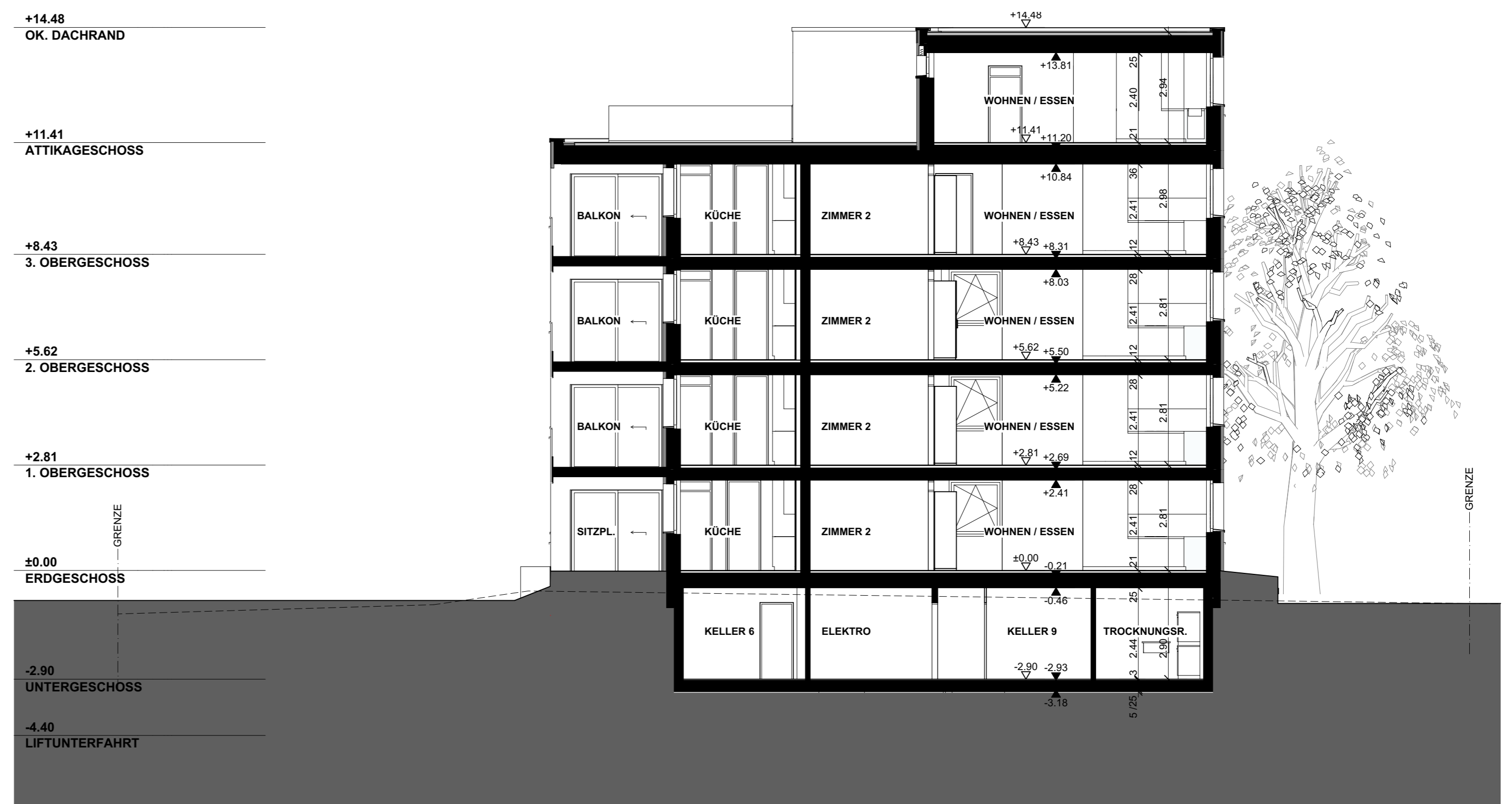
SCHNITT 2 1:100