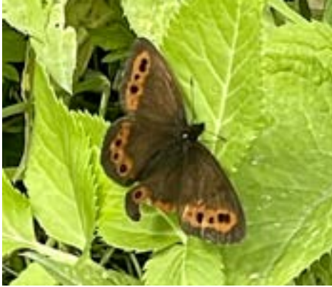
Weissbindiger Mohrenfalter