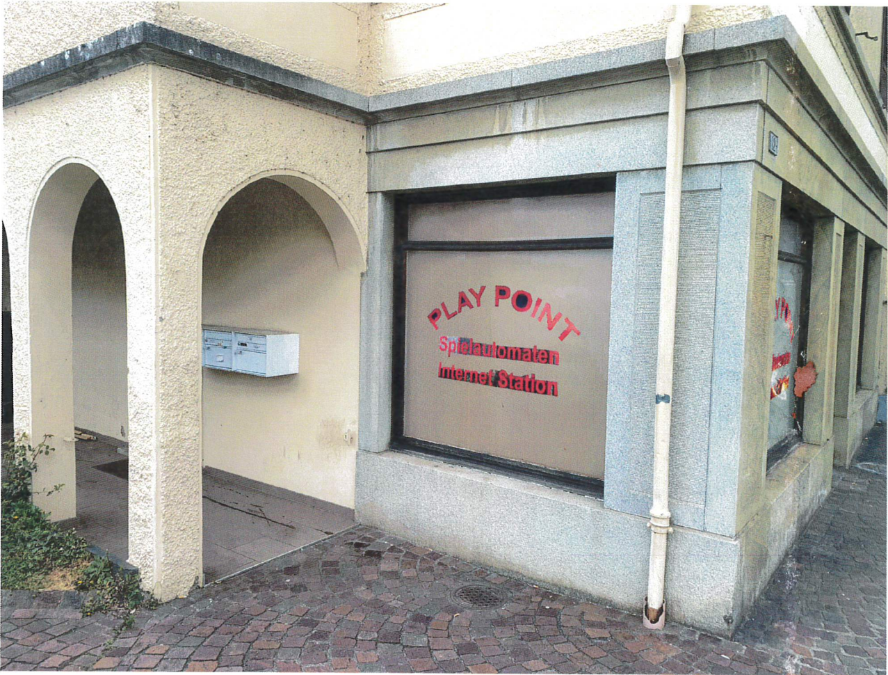
Ansicht Reklame (Pos.2)

Umnutzung Dorfstrasse 12 5036 Oberentfelden